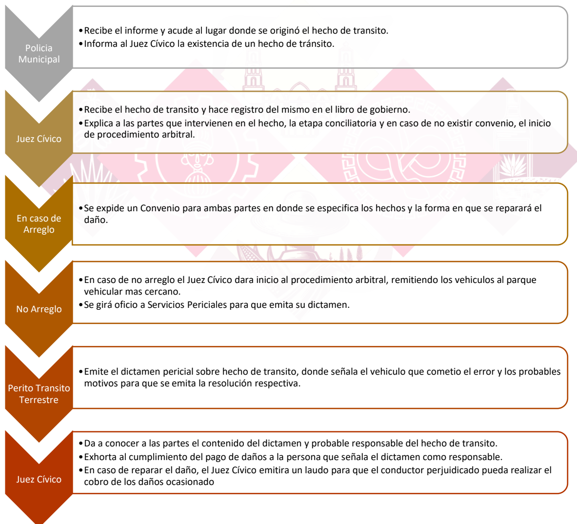
DIAGRAMA DE FLUJJO DE PROCEDIMIENTO.

Alcance: Aplica a la ciudadanía en general y siempre y cuando el hecho de tránsito sea dentro del territorio del municipio y entre particulares, así como al Juez Cívico, Secretario Cívico, Facilitador Cívico y los Policías de la Comisaria de Seguridad Pública.