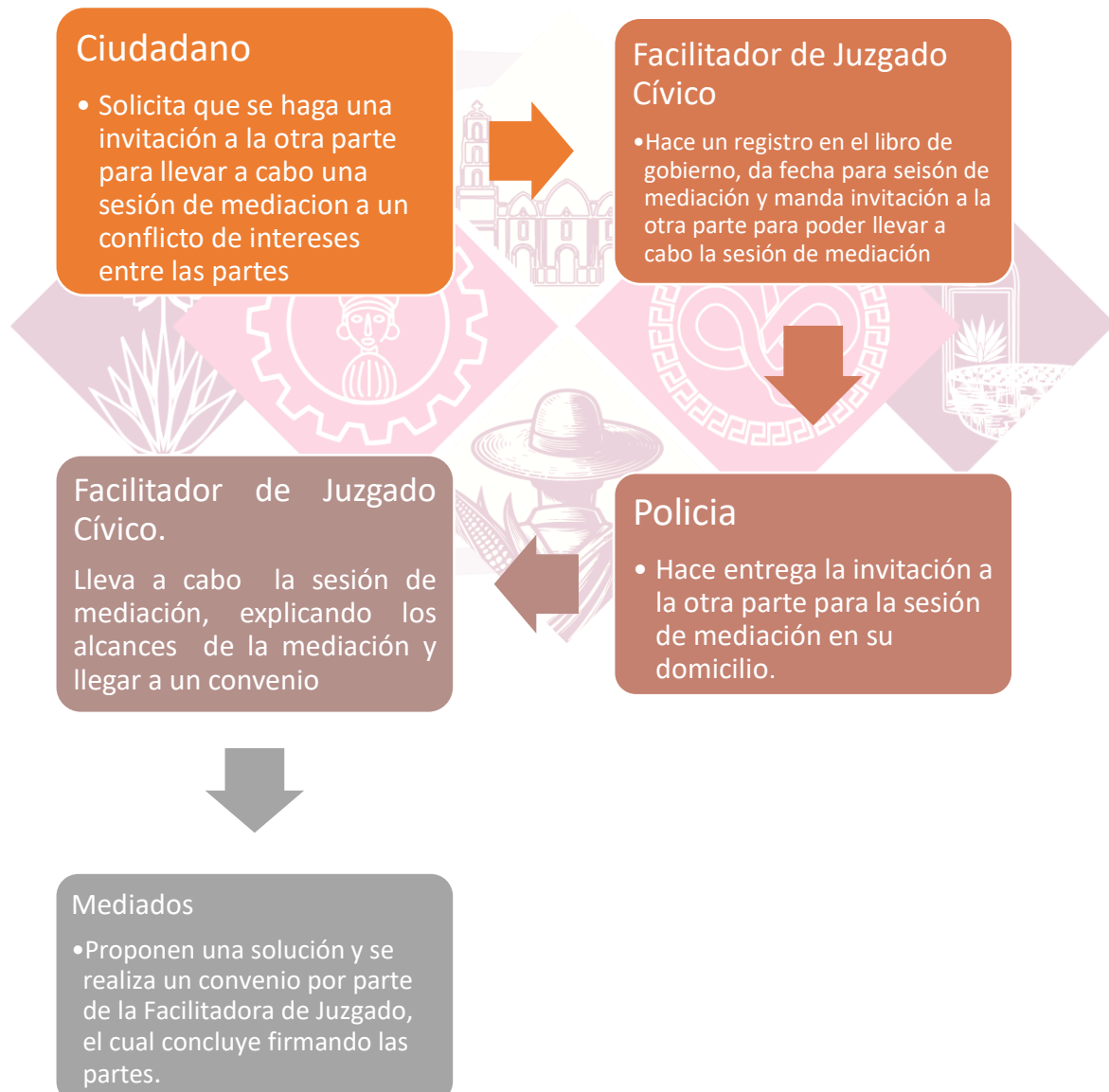
DIAGRAMA DE FLUJO DE PROCEDIMIENTO.

Alcance: Aplica a la ciudadanía en general siempre y cuando sea dentro del territorio del municipio, así mismo al Facilitador Cívico quien llevará a cabo sesiones de mediación entre las partes con el fin de dirimir algún conflicto y lo concluirá en un convenio o acta de mutuo respeto.